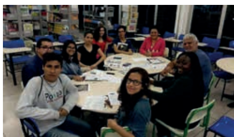
Equipe da revista conectados

A ETEC Prefeito Braz Paschoalin vem se destacando no Município de Jandira ano a ano, e particularmente neste ano de 2018, recebemos projetos impulsionadores da comunidade que vão desde a criação da revista CONECTADOS até aulas gratuitas de Capoeira e Muay Thai que são abertas ao público.