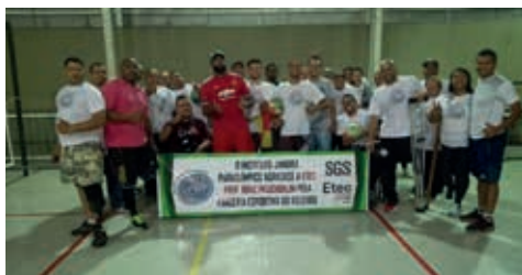
Equipe do Instituto Jandira Paraolímpico

Também acontece na Etec o vôlei sentado com a equipe do Instituto Jandira Paraolímpico, a qual utiliza a quadra da unidade escolar com acessibilidade ao deficiente para a realização dos treinos, e em contrapartida, o Instituto vem a divulgar o apoio da nossa escola em todos os torneios em que participam.